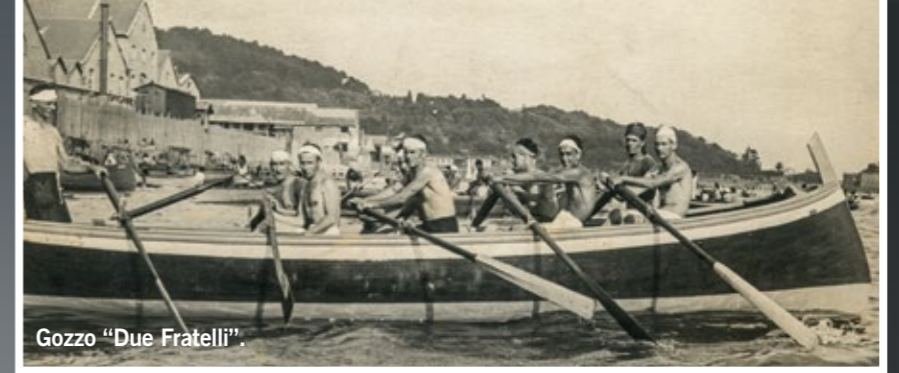
Gozzo "Due Fratelli".

Marinai e pescatori, tutti quelli che per tutta la vita passavano lunghe giornate di lavoro a remare, nei giorni di festa hanno sempre organizzato delle gare... di remo. Erano competizioni molto sentite perché mettevano in gioco la capacità, la forza e l'orgoglio professionale. Per lo stesso motivo, queste gare erano seguite da un pubblico numeroso e competente, da un "popolo di marinai" che non perdeva l'occasione di fare il tifo e scommettere i propri denari. Per le regate si