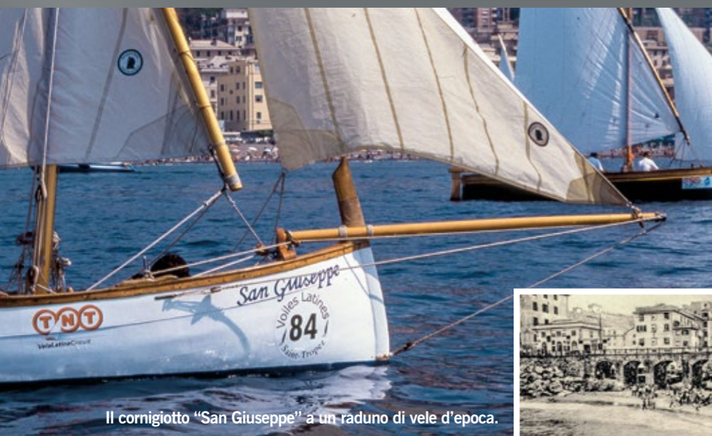
Il cornigiotto "San Giuseppe" a un raduno di vele d'epoca.

– definita dalla stessa delibera di Giunta "oggetto di speculazione e mercimonio" – da assegnare in uso ai pescatori "onde poter in tempo di mare burrascoso tirare in salvo i loro pescherecci". Contemporaneamente si provvedeva alla limitrofa creazione di un'area non edificabile, anch'essa destinata a ospitare i natanti e le attrezzature per la pesca – con apposita fonte per l'acqua e, successivamente, di lavatoi con speciali pozzetti per le reti – denominata subito dallo stesso Comune "Piazza dei Battelli", intitolazione che conserva tuttora"(2).