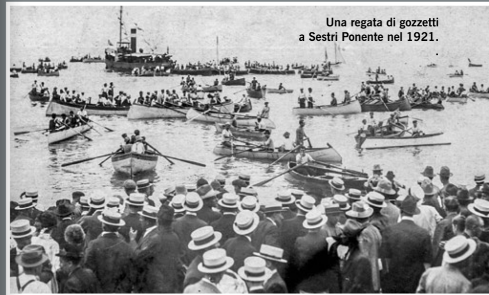
Una regata di gozzetti a Sestri Ponente nel 1921.

na, appunto), alla "Piazza Battelli" della vecchia stazione di Cornigliano, che era uno spazio urbano riservato alle barche dei pescatori e che oggi è diventato un parcheggio ben lontano dal mare, a vicoli "alla spiaggia" che si arrestano contro un muro dietro il quale si erge un rugginoso altoforno. Ma è proprio perché le tracce di questo passato marinaresco si sono fatte così tenui, che vale la pena di ricordare i tempi in cui lungo tutta la costa di Genova, anche a Ponente, "c'era il mare". Intendiamoci, si trattava di una costa che anche nel corso dell'Ottocento era stata già urbanizzata, dove accanto alle antiche e grandiose ville nobiliari delle maggiori famiglie genovesi e alle distese di giardini e di orti, si affacciavano cantieri navali e stabilimenti industriali. Non erano più i tempi nei qua-